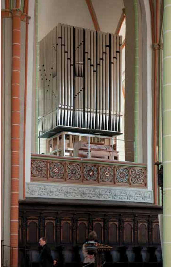
Chororgel in der St. Johannis-Kirche Lüneburg